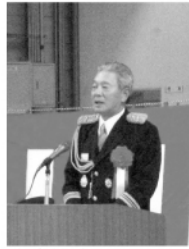
中泉協会長のことはお祝い

初任教育生は、九月十九日まで消防学校で共同生活をして、消防法などの座学と、救急・救助などの訓練を学ぶ。今回の入校生には、初めて県内四消防本部に新採用された五名の女性消防職員も入校し、新しい時代の到来となった。消防、救急救助などの現場では、女性職員の役割の分野が拡大しており、男性職員とともに研鑽を期待する。